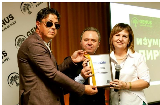
Квалификация «Изумрудный Директор»

Каждый из партнеров, стоявших на сцене, имел возможность сказать несколько слов о себе и о том, почему он выбрал компанию «Genus», поделиться своими эмоциями от сотрудничества и поблагодарить своих спонсоров и структуру.