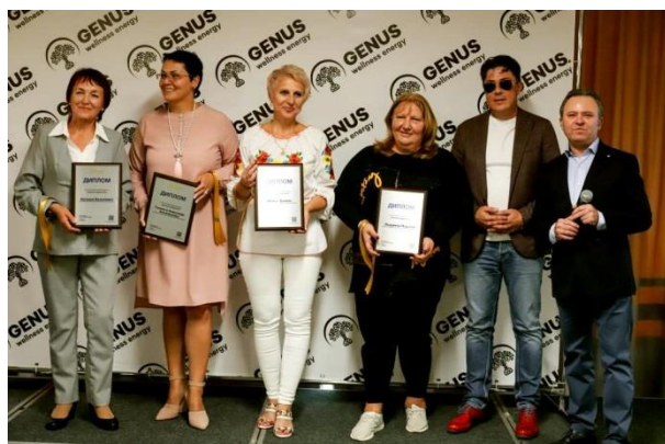
Квалификация «Золотой Директор»