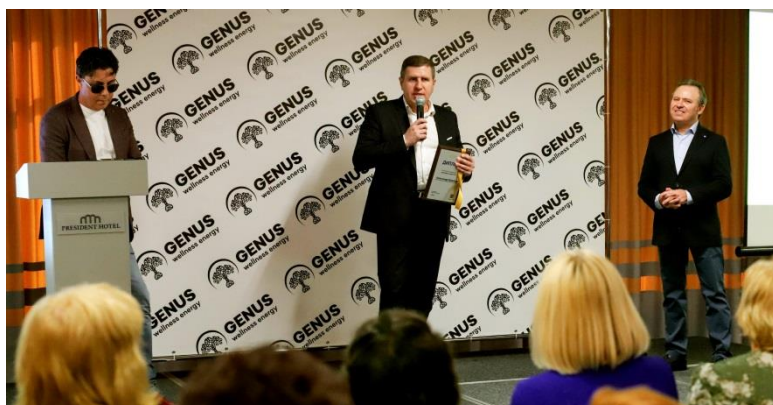
Квалификация «Платиновый Директор»