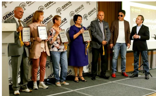
Квалификация «Серебряный Директор»